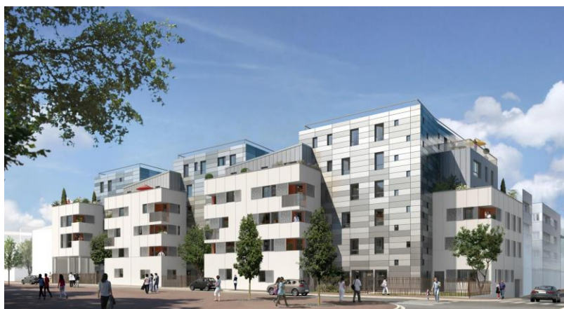
Architecte : CENCI & JACQUOT.

Au cœur d'un quartier en pleine mutation, l'ensemble immobilier réalisé par BNP Paribas Immobilier en R+5 représente près de 4 000 m 2 de surface de plancher et un parc de stationnement en souterrain de 23 places.